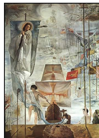
Descubrimiento de América, Salvador Dalí, 1955